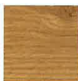
REF. 145 IRISH OAK