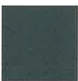
REF. 628 RAL ± 7012 BASALTGRAU GLATT