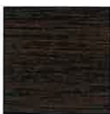
REF. 025 MOOREICHE