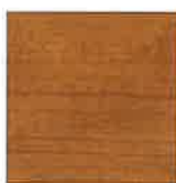
REF. 146 RUSTIC CHERRY