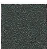
REF. 653 ALUX DB 703