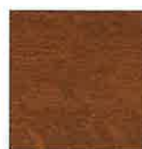
REF. 110 GOLDEN OAK