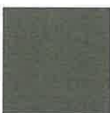
REF. 068 RAL ± 7039 QUARZGRAU