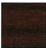
REF. 026 MAHAGONI