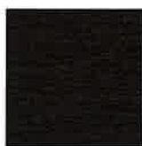
REF. 012 BRAUN