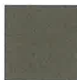
REF. 911 RAL ± 7039 GRAU ALUMINIUM GLATT