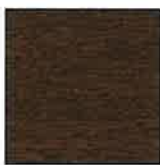
REF. 154 NUSSBAUM